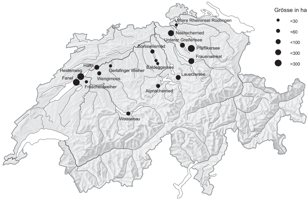
Abb. 1. Lage und Name sowie Grösse aller zur Zeit betreuten Schutzgebiete der Ala in der Schweiz. – Localisation, name and size of the current Ala reserves in Switzerland.

der ersten nichtstaatlichen «Moorschutz-Vereinigungen» in der Schweiz und seit 100 Jahren aktiv im Moorschutz dabei. Heute betreut die Ala 16 Schutzgebiete mit einer Gesamtfläche von 2120 ha in 7 Kantonen vor allem im Schweizer Mittelland (Abb. 1, Tab. 1).