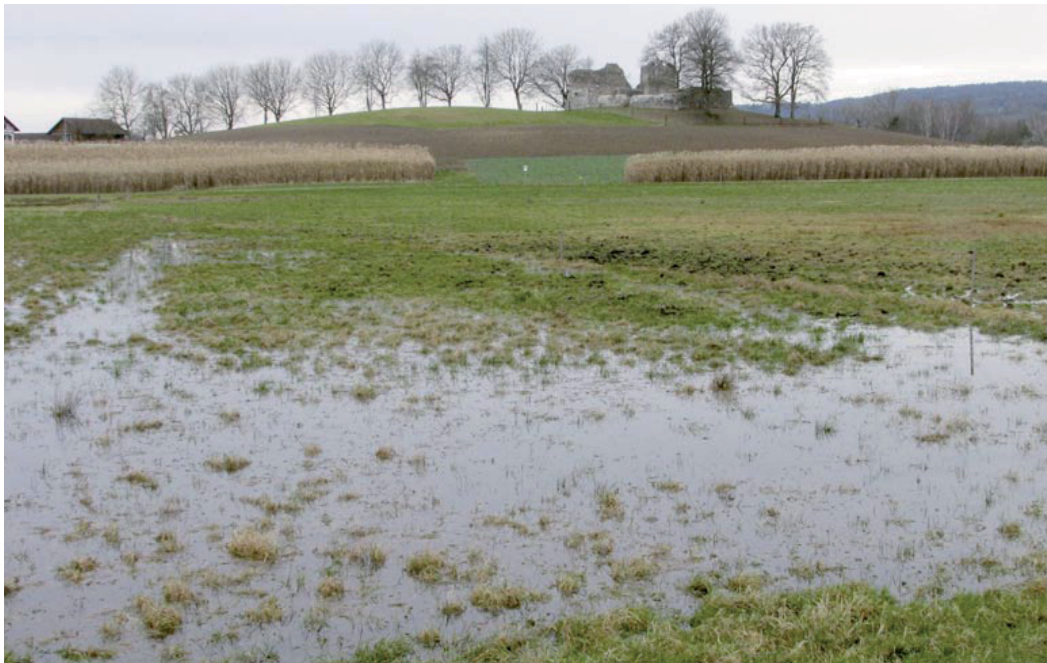
Abb. 3. Ein wichtiger Bestandteil des Kiebitzlebensraums sind vernässte Flächen wie hier beim Nussbaumer See (Kanton Thurgau). Sie schaffen Nahrung und erhöhen die Sicherheit vor Prädatoren. – An important requisite in the habitat of the Lapwing are wet sites.

In der Praxis sind diese beiden Mortalitätskategorien kaum zu trennen. Ein Mortalitätsfaktor wie die Prädation ist also nicht zwingend und in jedem Fall als negativ zu beurteilen. Verlus-