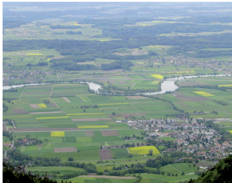
Abb. 4. Die von Flüssen geprägten Gebiete im Mittelland waren einst wichtige Habitate für den Kiebitz. Sie bieten auch heute noch viele Möglichkeiten zur Kiebitzförderung. – The plains along the rivers were once strongholds of the Lapwing population in Switzerland. They still offer several opportunities to recreate suitable habitats.

Wo Kiebitze im Kulturland brüten, müssen mit den Bewirtschaftern Lösungen gefunden werden, um die Nester vor der Zerstörung durch Mahd oder Pflügen zu bewahren. Im Wauwilermoos werden zusammen mit den Bauern kiebitzverträgliche Kulturen evaluiert: Eine vom Kiebitz besiedelte Parzelle wird bis Ende Mai, wenn die Jungen in allen Nestern geschlüpft sind, nicht bewirtschaftet. Erst danach erfolgt etwas verspätet eine Mais- oder Wiesenansaat. Der Ertragsverlust wird vergütet (Schifferli et al. 2009). Vogelschützer können einen wichtigen Beitrag leisten, indem sie Brutpaare bzw. Nester lokalisieren, die Bewirt-