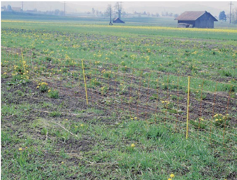
Abb. 3. Der 2008 mit Kartoffeln und Futterrüben bepflanzen Acker lag über den Winter 2008/09 brach; auf einem Teil wurde eine Gründüngung eingesät. Auf dem 1,1 ha grossen eingezäunten Brachacker brüteten 7 Paare. Aufnahme vom 21. April 2009, L. Schifferli. – This field with potatoes and fodder beet in 2008 remained fallow over winter 2008/09, 1.1 ha holding 7 nests. Cultivation was postponed until 23 th May, when 5 clutches had hatched and chicks were at least two weeks old.

Die Erfolgsaussichten der im brachliegenden Ackerland angelegten frühen Bruten waren jedoch äusserst gering. Denn die Felder wurden noch während der Bebrütungszeit flächendeckend maschinell bearbeitet (Abb. 5). 2004 gab es Anfang Mai kein einziges aktives Kiebitznest. Die 11 anschliessend gefundenen Gelege waren vermutlich grösstenteils Ersatz für die