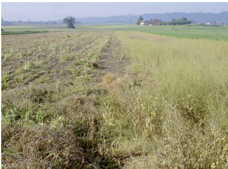
Abb. 5. Gepflügter bzw. geegter Acker zur Ansaat von Kartoffeln. Zum Schutz der Kiebitzgelege wurde eine kleine Fläche ausgespart. Vier der 5 Gelege in diesem Feld wurden weiter bebrütet, doch wurden 3 später ausgeraubt. Aufnahme vom 14. April 2005, L. Schifferli. – This field was ploughed and harrowed for planting potatoes. To save the Lapwing nest, the farmer avoided the nest site by leaving a small patch uncovered by the machines. In 4 of 5 clutches incubation continued, but 3 were predated later.

Abb. 4. Derselbe Brachacker wie in Abb. 3, einen Monat später. Rechts locker wachsende Gründüngung, Höhe bis 45 cm, links ohne Einsaat, Vegetationshöhe bis 20 cm. Die Vegetation wurde am 13. Mai mit Herbiziden behandelt. Aufnahme vom 23. Mai 2009, J. Walker. – The same fallow field as in Fig. 3, one month later. Vegetation height up to 45 cm (right) and up to 20 cm (left). It had been treated with herbicides 10 days before.