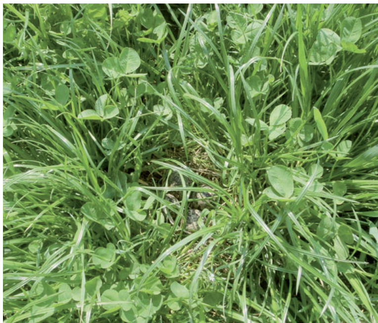
Abb. 7. Dieses Kiebitzgelege in einer Mähwiese wurde verlassen, als die Vegetation eine Höhe von 20–30 cm erreichte. Aufnahme vom 22. April 2009, A. Riederer. – This nest in a meadow was deserted when the grass height was 20–30 cm.

aufgegebenen wurden, waren die Kulturen am Neststandort durchschnittlich 44 \pm 12,3 cm hoch (Mittelwert \pm Standardabweichung). Drei dieser Nester befanden sich in dichten, etwa 30–40 cm hohen Kunstwiesen (Abb. 7), zwei in 40–60 cm hohen Maiskulturen und je eines in 40–60 cm hohen Rüben- bzw. Kar-