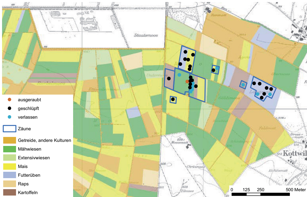
Abb. 8. Landwirtschaftliche Kulturen, Kiebitznester und Elektrozäune im Wauwilermoos, 2007 (nach Rickenbach 2008). – Map of the study area in 2007 with crops, electric fences (blue lines) and Lapwing nests (dots, red = predated, black = hatched, blue = deserted). Crops are: cereals, other crops («Getreide, andere Kulturen»), meadows mown regularly («Mähwiesen»), meadows used at a low intensity («Extensivwiesen»), maize («Mais»), fodder beet («Futterrüben»), oilseed rape («Raps») and potatoes («Kartoffeln»; after Rickenbach 2008).

Die aufgrund der Telemetrie-Ortungen ermittelten Überlebenskurven bis 40 Tage nach dem Schlüpfen der Jahre 2006 und 2007 verlaufen sehr ähnlich und illustrieren die hohe Sterblichkeit in den ersten zwei Lebenswochen (Abb. 9). Bereits nach drei Wochen sank die Zahl der Überlebenden unter 0,7 Junge pro brütendes Paar. Obwohl 2006 und 2007 82,2 bzw. 71,9 % der Gelegen schlüpften, wurden nur 0,25 bzw.