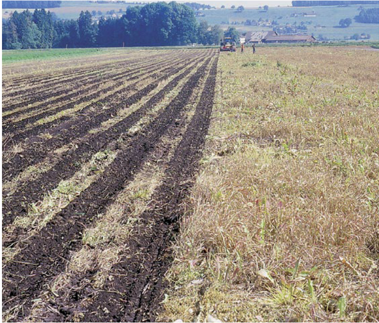
Abb. 6. Anschliessende Direktsaat von Mais (links) in den gleichen Brachacker wie in Abb. 3 und 4. Um den Neststandort möglichst wenig zu verändern, wurde ohne zusätzliche Bodenbearbeitung ange-sät. Zwei Gelege wurden während des Maschi-neneinsatzes entfernt. Eines wurde verlassen, das andere schlüpfte. Aufnahme vom 23. Mai 2009, L. Schifferli. – To spare the Lapwing nest site, maize was sown directly into the crude soil (left) of the fallow field shown in Fig. 3 and 4. The two unhatched clutches were taken out before cultivation and brought back thereafter. One was deserted, the other hatched.

den Schutz der Bruten vor der Landwirtschaft konnte also ein namhafter Teil der frühen Gelege vor der Zerstörung durch Landmaschinen bewahrt werden.