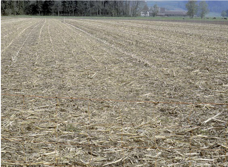
Abb. 2. Dieses Maisstoppelfeld lag seit der Ernte im Herbst 2008 brach. In der 1,1 ha grossen eingezäunten Parzelle brüteten 9 Paare. Die für Anfang Mai vorgesehene Maisansaat wurde auf den 23. Mai verschoben, als die Küken mindestens 10 Tage alt waren. Aufnahme vom 21. April 2009, L. Schifferli. – Maize stubble field remaining fallow over the winter 2008/09, 1.1 ha, holding 9 Lapwing nests. Cultivation was postponed until 23 th May, when 7 clutches had hatched and chicks were at least ten days old.