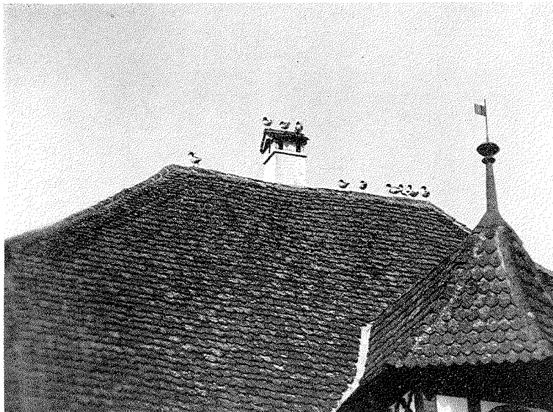
Brandenten auf dem Rathaus von Sempach (Mai 1933).

vollständig zusammen, die Enten wurden wieder friedlicher und das alte regelmässige Hin- und Herfliegen in der Futterzeit vom See zum Garten setzte wieder ein.