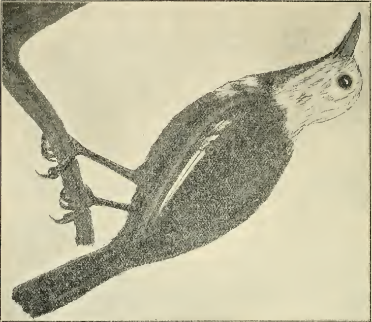
Vor der Mauser.

Albinotische Amsel im Schützennattpark zu Basel.